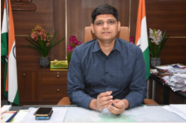
ఈ యుగాది వర్షదినం ప్రతి ఒక్కరి జీవితంలో కొత్త ఆశలు, అవకాశాలు, విజయాలను తీసుకొవాలని జిల్లా పాలనాధికారి ఆకాంక్షించారు.

యుగాది తెలుగు నూతన సంవత్సరానికి ఆరంభ సూచికగా నిలిచే వర్షదినమని, ఇది మన సంస్కృతి, సంప్రదాయాలను ప్రతిబింబించే విశిష్టమైన వేడుక అని ఆయన తెలిపారు. ఈ శుభ సందర్భంలో ప్రతి కుటుంబం సుఖసంతోషాలతో, ఐశ్వర్యంతో, ఆరోగ్యంతో నిండిపోవాలని ఆకాంక్షించారు.